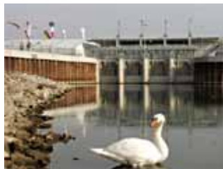
Der Polder Söllingen/Greffern