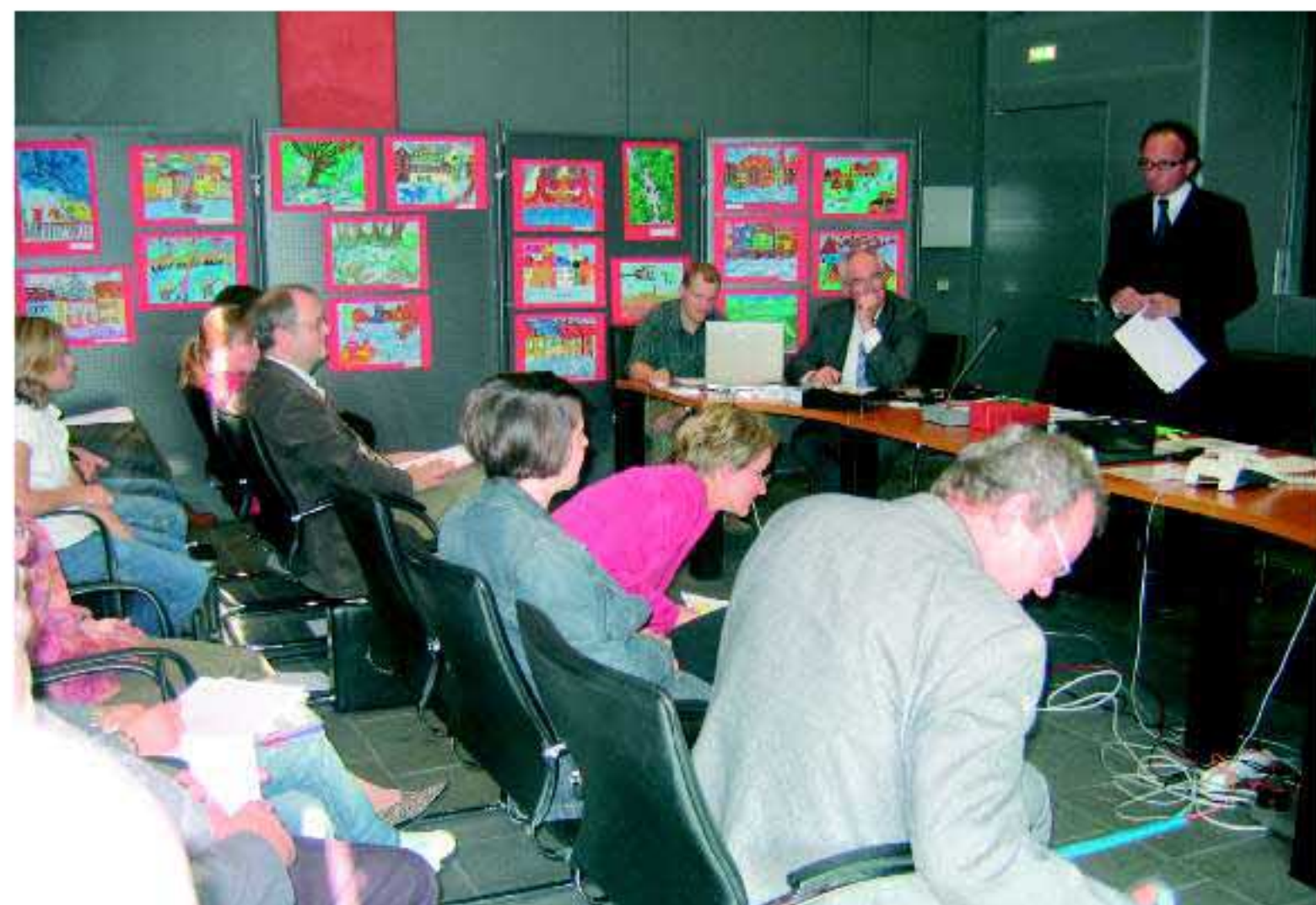
Verleihung des Hochwasserpreises 2005 in Köln

Der Hochwasserpreis ist eine wichtige Möglichkeit zur Sensibilisierung der Bevölkerung auch bei Niedrigwasserständen.